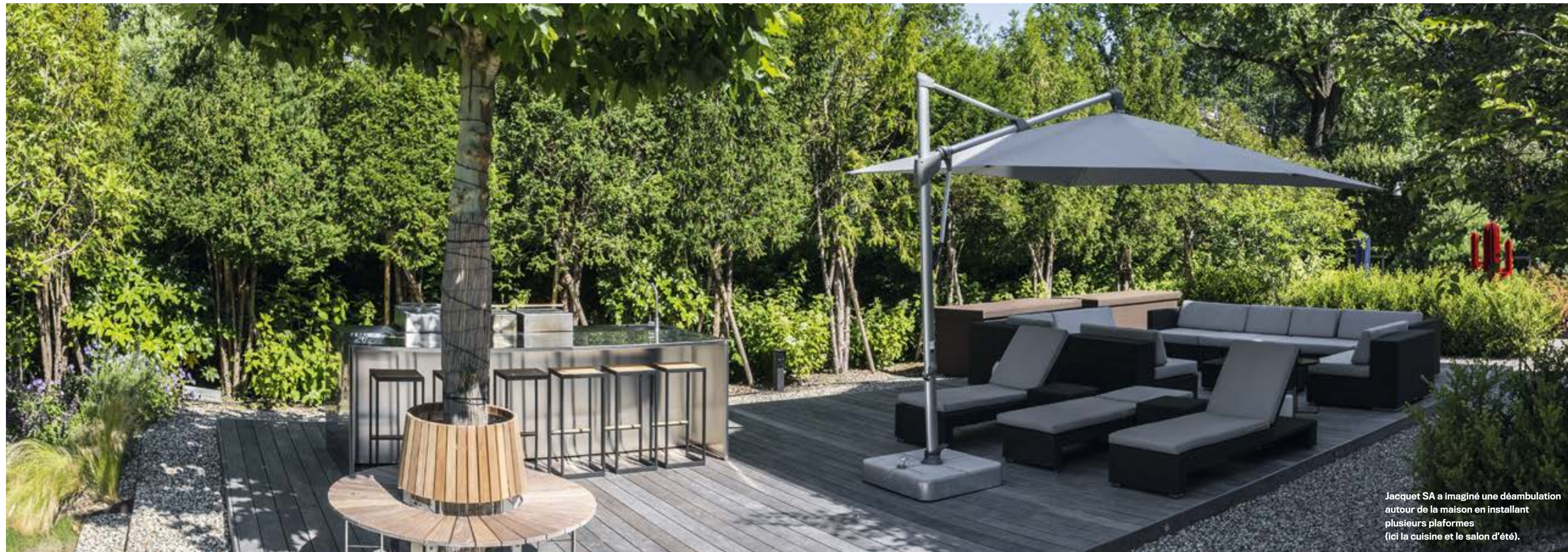
Jacquet SA a imaginé une déambulation autour de la maison en installant plusieurs plateformes (ici la cuisine et le salon d'été).